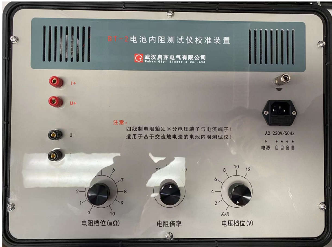
圖 1 整體外觀